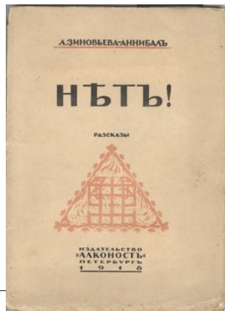
«НѢть!». Сапфическія рассказы