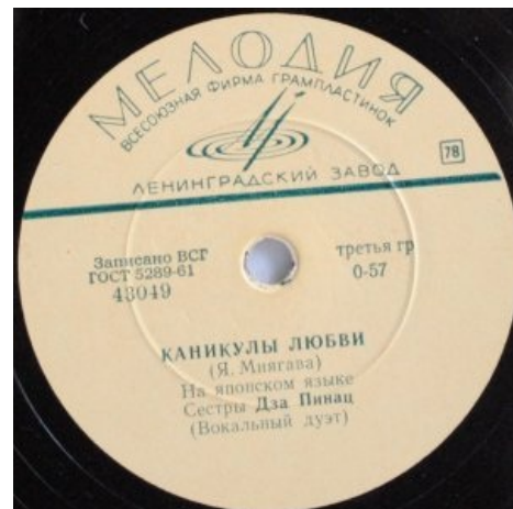
Сёстры Дза Пинац, десу

А бывают и вынужденные надмозги — когда перевод попросту невозможен, или когда речь идет о чем-то, совершенно непонятном в нашей стране. Так, рассказ Дж. Д. Сэлинджера под названием «Uncle Wiggily In Connecticut» в переводе называется «Лапа-растяпа». Дословный перевод потребовал бы тщательного объяснения, кто такой этот uncle Wiggily — тогда как в Солнечном Пиндостане это имя многим известно с детства (это хромой кролик, герой детских книжек). Алсо, названия многих японских книг и фильмов с большим трудом переводятся на другие языки. Например: фильм «Сцены у моря» по-японски дословно называется «Тем летом было самое спокойное море». Также встречается ситуация, когда, к примеру надмозги переводят не с языка оригинала, а с другого надмозга (часто встречается в аниме-среде, когда наши переводят не с лунного, а с англиша), однако, чтобы не получилось ебанины (например, когда последующее предложение по вине предыдущих надмозгов не имеет связи с предыдущим), интерпретируют фразу по-своему, что вызывает лютый бугурт у некоторых умников, которые имеют некоторые познания в языке.