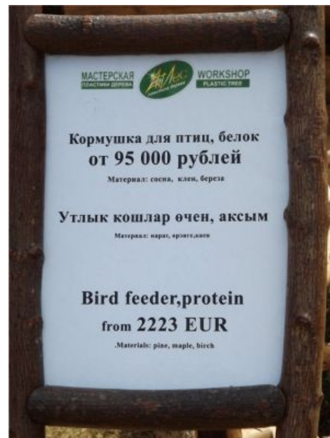
Bird feeder, protein

Песня матан -инженерно-программных терминов на английском заигрывает с неоднозначностью перевода уровня "naked conductor"