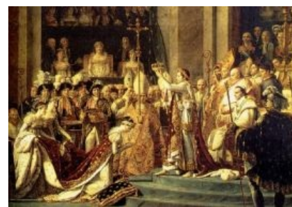
Короновал император сам себя

(Параллели с происходившем на Украине в 1914-18 и 1941-45 напрашиваются)