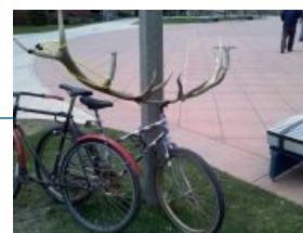
И велосипедисты туда же.