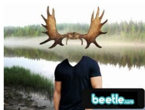
Шаблон для фотшопа намекает...

По данным справочной службы русского языка, у выражения «наставить рога» существует четыре версии происхождения: