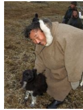
Настоящий индеец этой страны.

Следует понимать, что в американских разборках индейцев использовали очень активно. Знаменитый Эрнандо Кортес , фактически, сколотил союз племён, который прибил ацтеков, которые всех задолбали своими жертвоприношениями; сначала Англия и Франция, а потом США и Англия устраивали пограничные