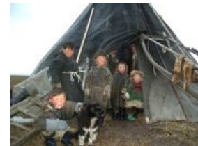
Личинки индейцев этой страны.