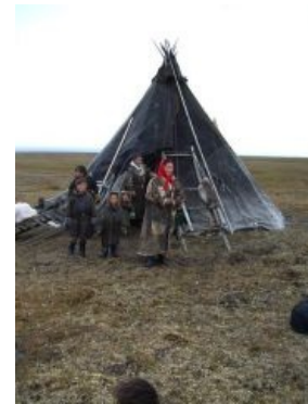
Жилище настоящего индейца этой страны.