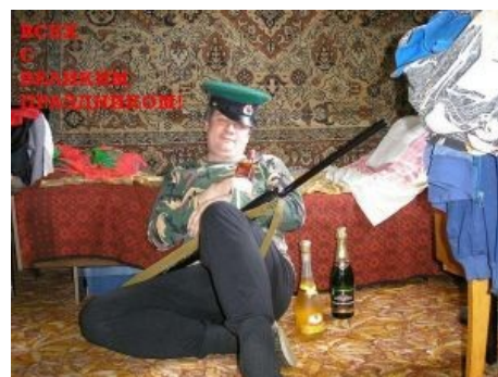
Совсем конченный вариант. На фоне ковра . И горизонт, как водится, завален — всяким мужыцким барахлом ...