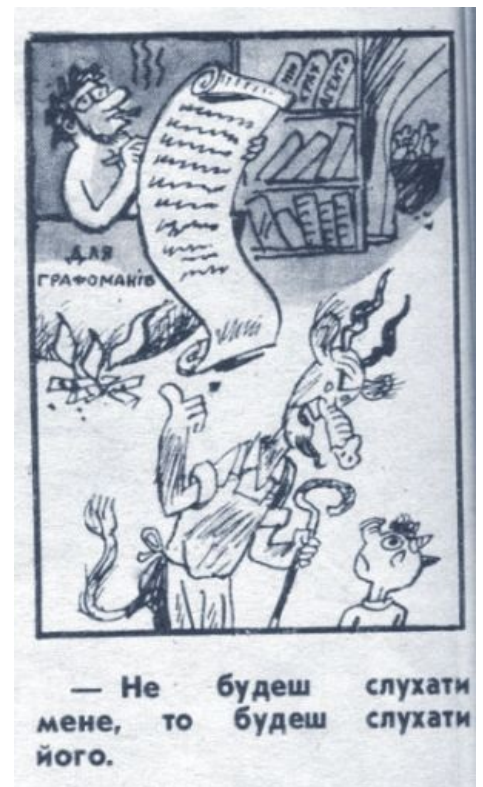
В аду гарфоманами пугают чертей. Укро-карикатура