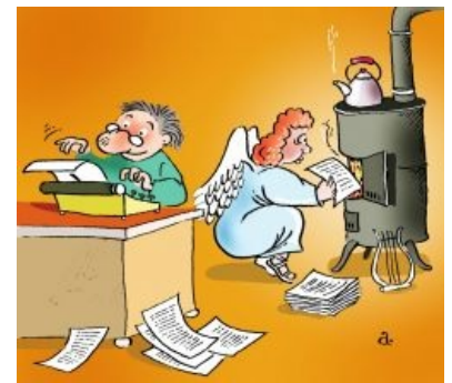
Твой труд не напрасен

Как правило, рассвет писательской карьеры в подобных случаях связывается с острым недоёбом и, соответственно, закат приходит