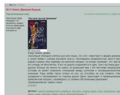
Романтика нового поколения

И если у гордых обладателей МПХ вся романтика рассказов в основном сводится к «гуляли — поебались — поженились», то милые дамы в этом вопросе проявляют просто поразительную изощрённость, снова и снова с усердием морского прилива накрывая воспалившийся моск читателя потоком беспросветной хуиты. История может начаться с описания чувств верной жены,