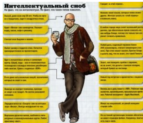
Интеллектуальный сноб очень интеллигентен