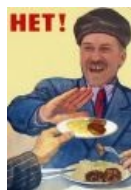
Нет, с пюрешкой! S.T.A.L.K.E.R.