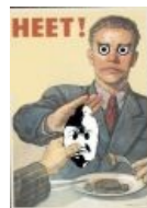
Вот это ВИД!