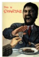
This is SPARTA!