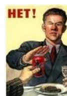
Никакой «Кока- колы»