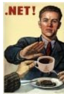
C# vs Java