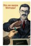
Соитиро Ягами не рекомендует