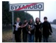
Косплей от «Арии»