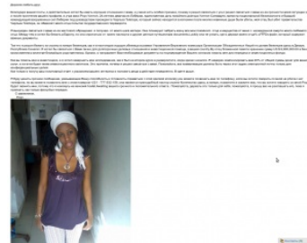
Пример «нигерийского письма» из Либерии.

Сабж уже стал пасхалкой — в недавно вышедшем Deus Ex: Human Revolution ГГ получает на мыло нигерийское письмо. И не только он. В расово неверной второй части Dragon Age аналогичное письмо получает Хоук. В Mass Effect Шепард также получает нигерийское письмо. В Doom 3 такое было у одного