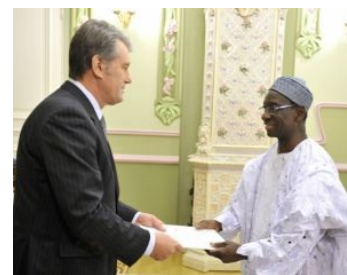
Президенты тоже получают нигерийские письма