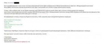
Мошенники помогают жертвам мошенников