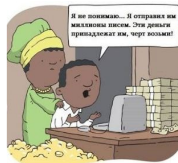
Где-то в Нигерии