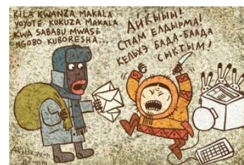
Они даже чукчей заебали