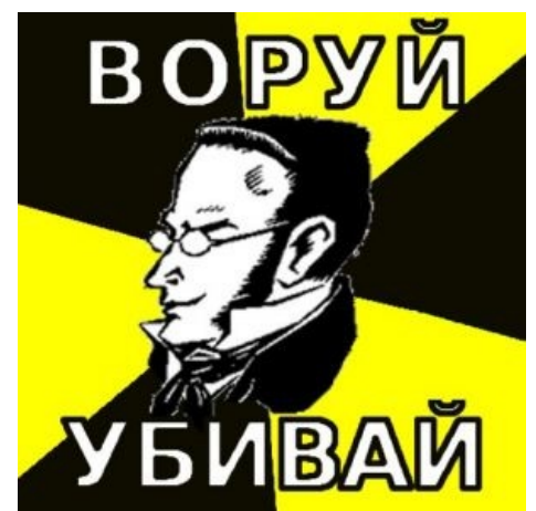
Макс Штирнер. Идеино близок.

https://www.youtube.com/watch?v=TDT19fU3a9I Ричард Хэлл — «Пустое поколение»