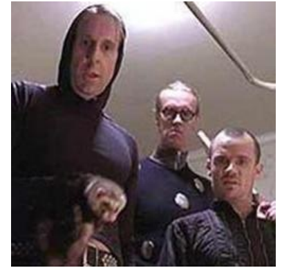
Нигилисты из фильма «Большой Лебовски»

Но не все способны выдержать абсолютную свободу, большинство людей СЛАБЫ , да и Ты тоже, и чуть что, сразу бегут под эгиду дешевых протезов в виде этики, морали и веры. Вас всех, ваши судьбы, не моргнув глазом, может уничтожить любой нигилист, лишь был бы повод. Только поводов у него немного, а точнее, всего один: ваша несознательность и неосознанность, которой вы ставите себя на одну доску с неживой природой, и даже ниже — ведь у вас есть возможность выбора. Нигилист такой возможностью пользуется, дорожит ею, несмотря на то, что это приводит к разрушению его уютного внутреннего мирка. Разрыв социальных связей, отказ от любимых привычек, переосмысление шкалы оценок и, возможно, жестокий ангст — далеко не полный список того, что, возможно, придётся испытать тебе на пути к нигилизму. Именно опыт подобных переживаний ставит нигилиста в стороне от общей массы, в одиночестве, отдельно от тех, кто этого не испытывал (во всяком случае не нарывался на