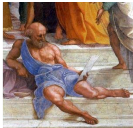
Трушный нигилист циник

исторического материализма и рождения Христа в Древней Греции от учеников Сократа отпочковалась группа философов , называемых киниками (в позднелатинской транскрипции — циники). У этих товарищей было своеобразное представление о благе для души, заключалось оно в подавлении своих естественных потребностей и отрицании морали окружающего их общества, всё ради освобождения разума и уподобления себя богам, которым чужды человеческие страсти и вкусы . Чтобы добиться желаемого, они вытворяли натуральный эпатаж: ходили в рванье, бомжевали на площадях, гадили на ковры мажорных сограждан etc. Из-за выбранного ими образа жизни их школа и получила прозвание кинической, то есть собачьей, но киники не считали такое высказывание о них чем-то плохим . Когда некий афинский аристократ во время пира кинул Диогену кость со стола, последний принял её, подполз к тому господину и, задрав ногу, поступил с ним по-собачьи. Если ранние циники были, ко всему прочему, чрезвычайно образованными и могли себе позволить подобные шалости, то всего сто лет спустя кинизм из философского учения выродился в тупой угар над такими-как-все, но уж люди, называвшие себя последователями школы, ничем, кроме