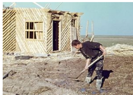
Строительство клуба рядом с