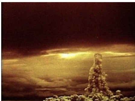
Кузькина мать в профиль.

« Мы вам покажем кузькину мать ». 24 июня 1959 года во время осмотра американской выставки в Сокольниках Хрущёв сказал вице-президенту США Ричарду Никсону: «В нашем распоряжении имеются средства, которые будут иметь для вас тяжкие последствия. Мы вам ещё покажем кузькину мать!» Переводчик в замешательстве перевёл фразу дословно: «Мы вам покажем ещё мать Кузьмы!» Однако, согласно не фольклорно-советской , а американской версии переводчик перевел иносказательно: « We will show you what is what! » Хотя как и в предыдущем случае Хрущ вкладывал в значение этой фразы смысл отличный от общепринятого. По воспоминаниям ближних он подразумевал, что «мы вам покажем то, что вы еще не видели». Переводчики до сих пор фалломорфируют.