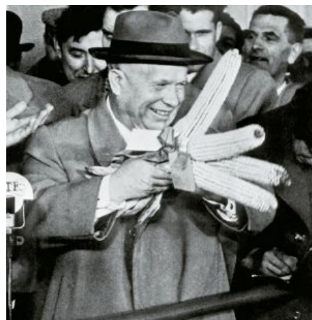
Сабж и всенародные семена МНХ ЧГУ .

Поющая кукуруза (первая реклама в СССР) Человек, похожий на Хрущёва , поёт оду маису