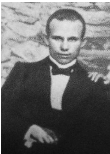
Хрущ. Мыкыта Хрущ.

Царь хлопов родился в 1894 году в Курской губернии (село в пару километрах от Украины) в семье шахтёра. Зимой посещал школу и обучался грамоте, летом грабил пас корованы . В 1908 году, переехав с семьей на Успенский рудник около Юзовки , Хрущёв стал учеником слесаря на заводе, потом работал слесарем на шахте и как шахтер не был взят на фронт в 1914 году. В 1918 году Хрущёв вступает в партию большевиков и участвует в Гражданской войне .