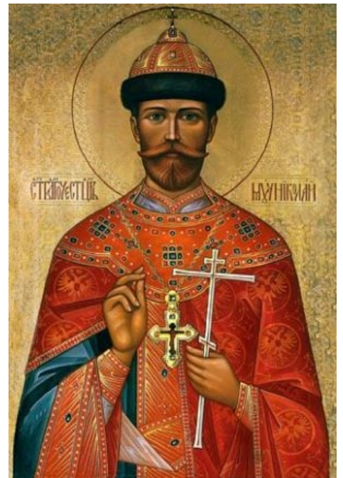
Св. небесный покровитель кроухантеров

Яков Юровский, непосредственно осуществлявший экстерминатус , уже в тридцатые так объяснял мотивы Уралсовета: вы нас упрекаете в беспределе , мол, мы детей убили, но в каких монстров выросли другие детишки голубых кровей? Дальнейшее развитие событий показало, что его горячее стремление к самосуду не было лишено здравого смысла. Николашка с детьми вполне мог стать марионеточным лидером для военной интервенции, каким через 23 года стал его самопровозглашенный преемник Владимир Кириллович Романов. Мы тут законный порядок возвращаем, ну и что, что немецкими снарядами? Кириллыч оправдывал своим священным монаршим долгом и правом решительно все, что делали белые колонизаторы — почему бы и Николашке так не поступить на 23 года раньше? Николашка хотя и считался в народе редким мудаком, но в глазах огромного процента верующих крестьян по привычке оставался «помазанником», то есть единственным легитимным представителем Бога на земле. С самой февральской революции было полно желающих заменить абсолютную монархию конституционной монархией. Если бы у большевиков не сложилось с крестьянской политикой, то кто знает, может быть и отречение оказалось бы написано юридически неправильно. К моменту