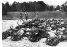
На бейне охоте