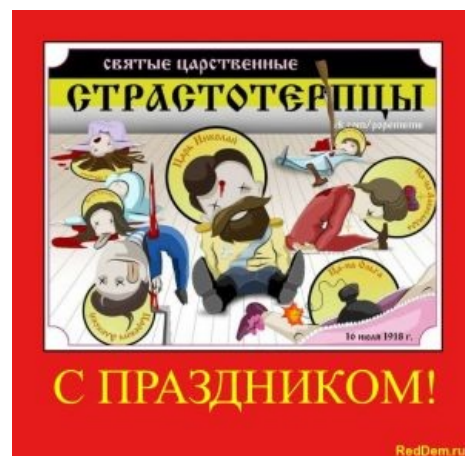
Коммуняки поздравляют Коленьку