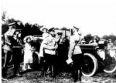
Николай II и Mercedes-Knight-40