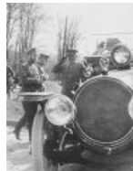
«Delaunay Belleville 45 CV». На радиаторе – свастика, символ императрицы Александры Федоровны