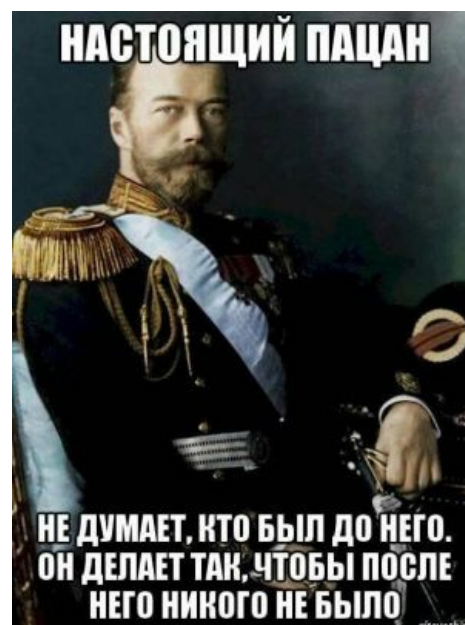
Николай II — настоящий мужик .

Насчёт того, что Распутин не траванулся цианидом, предлагается вполне рациональное объяснение: цианид положили в эклеры, а сахар — это антидот к цианиду. Пуришкевичу и Ко попросту помешало незнание химии. Но тут возникает другой вопрос — а достаточно ли было в них сахара и времени на нейтрализацию отравы «всухую»? Есть также версии, что травителям под видом цианида продали плацебо, либо заговорщик, который должен был положить яд, банально зассал и положил сахар.