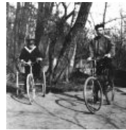
Сынок старательно бережёт локти от асфальтовой болезни. Гемофилия — не сахар