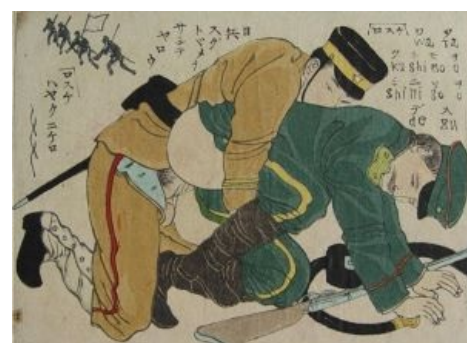
Вот примерно так оно и выглядело для современников

Основной проблемой на флоте и в армии было тотальное нежелание высшего руководства командовать без высочайшего позволения, под страхом жесточайшего анального наказания. Царь Николайчик очень боялся повторения восстания декабристов, поэтому кары раздавал не глядя. Результатом такого подхода к военному делу стала Цусима . Пехота тоже отжигала. Генералы делились на бездарей и бездарей, которые ещё и воруют — за очень редкими исключениями . В итоге одни просто тупо проёбывали битву за битвой, отступая при соотношении 3:2 и 2:1 в нашу пользу, а вторые ещё и имели с этого ПРОФИТ! В результате кавальная страна, которую и на глобусе-то не сразу разглядишь, победила эту страну , хотя потери японцев во много раз превышали потери русских, а самурайские генералы высрали немало кирпичей . Государственный долг Японии рос как на дрожжах, от недостатка рекрутов в армию начали призывать стариков и детей, а правительство уже планировало, как бы выйти из этой войны с наименьшими уступками, но царь-тряпка обделался и согласился на мир при посредничестве американцев.