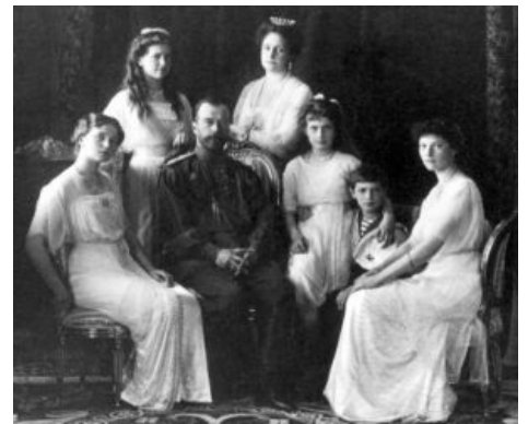
Выпиленное Августейшее семейство. «Ах, папенька, до чего вы изволили насъ довести!»

Апофеоз русского распиздяйства. К марту 1917 в правительстве адекватных людей не осталось вообще, как и в армии. Царь находился в Ставке Верховного Главнокомандующего, куда председатель Государственной Думы Родзянко писал ему письма относительно необходимости создания в стране ответственного перед Думой Министерства: это могло, подобно Манифесту 17 октября, отсрочить революцию, — но Николашка невозбранно слал его нахуй. Трушных офицеров выпилили в ходе войны, Питер был наводнён необученными солдатами, школотой, которая не хотела на фронт. А тут неожиданно подгоняемая собственной жабой, голодная до дешёвого хлеба толпа (хлеба в городе хватало, но жадные до PROFITa булочники злонамеренно выпекали только дорогие сорта : калачи, ситный, белые булки и прочее и прочая, а дешёвого и популярного в народе чёрного хлеба не пекли практически совсем ) начала очередное бурление. К ним присоединились рабочие, у которых мерзкий фабрикант зажилил кровную копейку, а после и солдаты, которые всеми силами старались оттянуть собственную отставку на фронт. В очередной раз положив на расклад, Николай II в результате получил один из самых большущих фейлов в истории России. Куча необученных солдат и студентов за неделю разогнала нахуй всё правительство и полицию, а потом и всю страну.