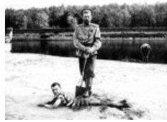
На берегу Днепра, 1916 г.