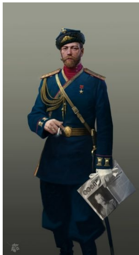
Царь был удостоен ордена за создание революционной ситуации в стране

был повешен боевиками-эсерами на конспиративной даче по предъяве в получении откатов от Департамента полиции. Убийство организовал на даче в Рутенберговских Озерках , действительный адресат откатов, Азеф .