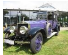
Отреставрированный Rolls Royce Ghost 1914 года. Доставлен за год до расстрела