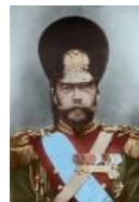
Спичка. Скоро всё вспыхнет