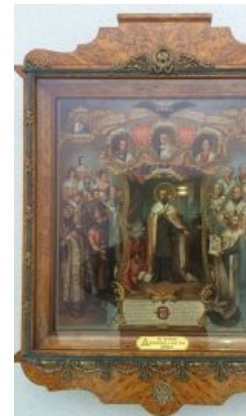
Официальная(!!) икона РПЦ с пособником нацистов Владимиром Кирилловичем Романовым.