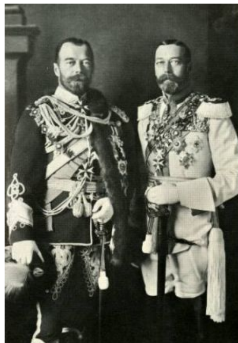
Николай II и Георг V. Найдите 10 отличий

Но Николашка заявил, что будет охранять самодержавие как папенька, то есть до последней капли крови... всех несогласных. Когда его робко попросили о привлечении «общественности» к большой политике, Николашка назвал это «бессмысленными мечтаниями». А потом оказалось, что и за сигаретами выходил не он, а его двоюродный брат, будущий Георг V. Главную роль в правлении абсолютного монарха-инфантила все 23 года выполняли женщины: сначала мамка, а затем и жена. Именно мамка надоумила Царя-тряпку забить на «общественность» хуй.