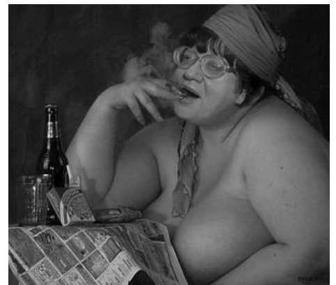
Новодворская такая Новодворская...