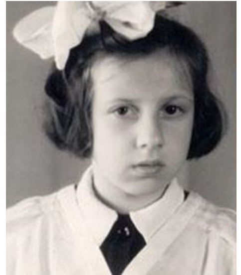
А как красиво всё начиналось...

В последние годы жила в уютненьком подмосковном посёлке Кратово, чем доставляла местному населению тонны лулзов. Особенно когда приезшему быдлу рассказывали, кто тут жил. Связь с общественностью поддерживала через ЖЖ , в котором регулярно (по несколько раз в день) выступала с разного рода статьями мессианского и учительского характера про то,