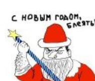
С новым годом, блеать