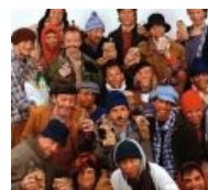
Типичное поздравление с НГ