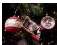
Новый год Рождество при Гитлере