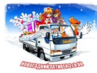
Новый год к нам мчится