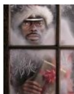
Дед Мороз приходит даже к битардам