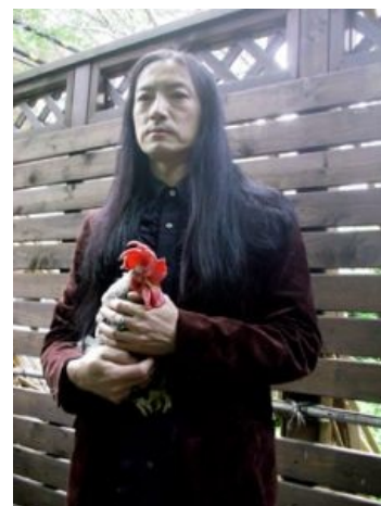
Merzbow и его сраный петух

Японцы были одни из первых, кто додумался использовать в творчестве не только обычные, но и компьютерные звуки, предпочитают также играть на самодельных инструментах. Пожалуй, нельзя не упомянуть центральную персону современного японойза — Merzbow, который начинал с ленточных экспериментов; в частности, он резал ленту на куски и склеивал заново в произвольном порядке. Если сначала он занимался этим из общей моды, то потом стал корчить из себя художника: формулировал собственные концепции и идеологии на замену классической человеконенавистнической: в частности, он заявлял, что шум по сравнению с музыкой бессознателен.