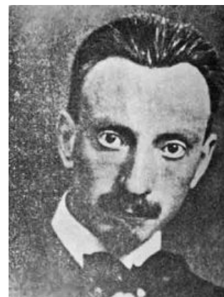
Батя-Луиджи, со взором стеклянным и недобрым

стал, и в 1913 году прямо заявил народу в своем манифесте L'arte dei rumori (рус. Искусство шумов ), дескать, мы уже продвинутые люди , и можем делать с музыкой так, как наши отцы делать не могли — а за старину хвататься всю жизнь нельзя. Народу умные мысли понравились, он собрался на концерт Руссоло четыре года спустя, и... Шаблон не просто затрещал, он полностью был изорван в клочья — итальянец выдал оркестрантам самодельные инструменты (естественно, акустические), и вместо того, чтобы исполнить нормальную музыку, они стали так пилить и гудеть , что слушатели сразу это безобразие освистали. Несмотря на провал у толпы, далеко не все об этом концерте забыли, и кто-то стал пытаться сделать подобное на дому.