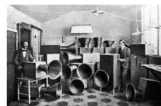
Шок и ужас толпы

Это безобразие очень популярно в узких кругах , и очень ненавидимо во многих других , благодаря своей шаблоноразрывности. Меломан с улицы, решив послушать нойз, обычно фалломорфирует от полного отсутствия у него не то что мелодии, но даже и какой-либо структуры. Все это потому, что нойз — штука весьма необычная и каких-то бешеных навыков для создания не требует; делать его может хоть дворник из Таджикистана, если узнает, в какое гнездо нужно воткнуть микрофон. Что характерно, так изначально нойз и развивался; его делали не музыканты, а вовсе наоборот — люди, причастные к музыке весьма вторично. Только потом, когда народ стал воспринимать скрежет и лязг как что-то высокохудожественное, подтянулись реальные музыканты и стали скрежетать и лязгать новыми способами. Самое смешное, что впустую их труды не пропали, и на сегодняшний день выродились уже больше 9000 способов издавать шумы именно так, как хочется их слушать конкретному человеку. Исторически сложилось, что шумом как музыкой заинтересовались примерно с того самого момента, когда звук понадобилось записывать на разные носители — сначала, стало быть, пластинки , а позже и магнитофонные ленты.