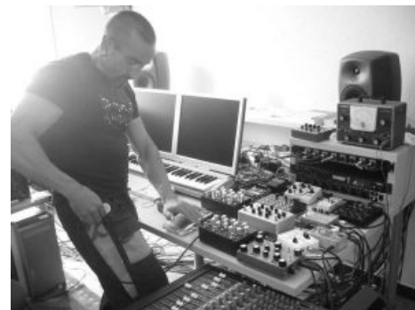
Так его и делают

Нойз (англ. noise music , рус. Ааааа, выключи эту пакость!! ) — жанр разновидность музыки, являющаяся тем, что обычная музыка классифицирует как нежелательное . По факту — предтеча современной индустриальной музыки, на деле же являет собой разнообразные шумовые эффекты сильно немusical направленности. Под нойзом понимаются те звуки, которые вызывают у рядового обывателя желание взять и выключить ; в данном ключе есть две достаточно ясные цели: издать звук как можно более громкий и как можно более необычным способом, вследствие чего притрагивающиеся к данному жанру личности обожают экспериментировать над звучанием, выдавая порой такое, от чего волосы выпадают за секунды.