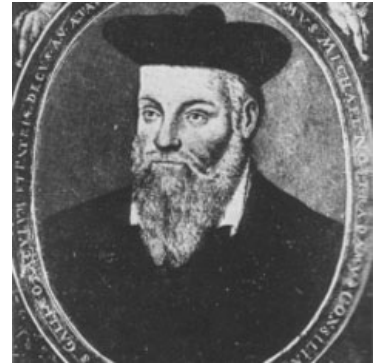
Нострадамус в кипе

Нострадамус (евр. рас. : מישל דה נוסטראדמוס, Мишель де Нотрдам, Предсказамус, No! Stradamus , 14 декабря 1503 — 2 июля 1566) — расовый французский ЕРЖ, тролль и наркоман . Прославился тем, что даже спустя столетия после смерти умудрился напрочь заморочить моск миллионам людей, от хомячков до политиков.