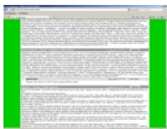
Голодомор и ВНЕЗАПНО нохчи.