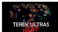
Толсто, очень толсто.