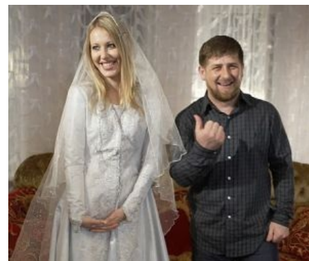
Вдуть или не вдуть?

Совсем недавно здесь рвались снаряды, лилась кровь всех народов России. Теперь здесь мир и своеобразный порядок. Как в тюремном бараке. Но ростки цивилизованного общества видны и здесь. Многие гуляющие смотрят на ничем не примечательное здание, что-то шепчут друг-другу слегка показывая пальцем. Просвещенные знают тайну, которая давно перестала быть тайной. В обыкновенном доме скрыто нечто совсем необыкновенное для патриархального мусульманского города, а именно гей-клуб. С торца дома видны массивные ворота подземного гаража. Не проходит и десяти минут как Porsche Cayenne с выключенной мигалкой подъезжает к дверям. Стекла машины наглухо тонированы в них отражается только противоположная сторона