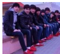
Мокасины, мокасины everywhere!