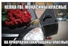
Народное творчество. Кавай .