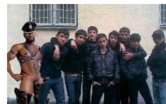
ЧВ с нами — русня под нами.

Оскар - Мажь вазелином Нохчи-ахтунг (внезапно, да?)