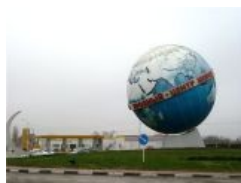
Выше только нёзды звёзды.