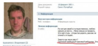
Пример ОБВМ вконтакте

К примеру (Осторожно! После чтения сего возможно внезапное повышение мудрасти и знания этого мира):