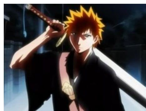
Обыкновенный японский школьник Ичиго Куросаки