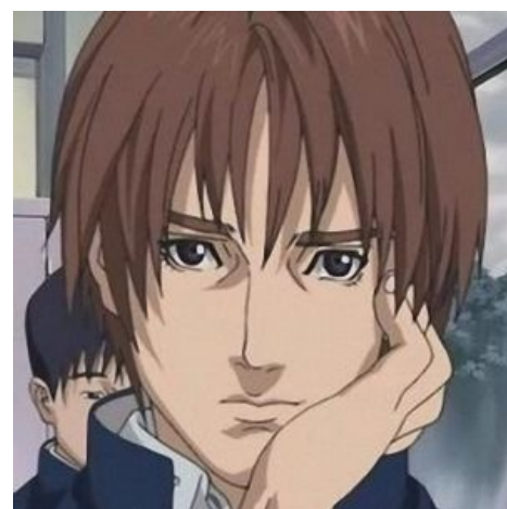
Обыкновенный японский школьник Кей Куроно — такой обыкновенный

Несмотря на то, что аниме предполагает невообразимое множество тем, персонажей и стилистики, ОЯШ всегда будет одним и тем же, вплоть до внешности, проблем и основополагающих черт характера. Именно это предполагает слово «обычный» в названии типажа и успешность его соотношения с аудиторией, что поможет подключится к совершенно любому из указанных ниже завязок и сеттингов. Это же позволяет свести описание любого ОЯШа к определённому подвиду: