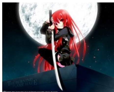
Кавайная лоли с катаной

Независимо от дальнейшего развития и общего качества сюжета аниме, в 93,635% случаев завязка будет выбрана из нижеследующих розовых мечтаний любого гика .