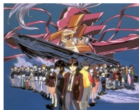
Обыкновенные японские школьники в космосе, тысячи их!