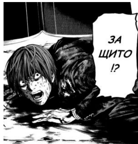
Обыкновенный японский школьник Ягами Лайт в не лучший день своей жизни.

Пример — Zero no Tsukaima , Shining Tears X Wind , KonoSuba , ReZero