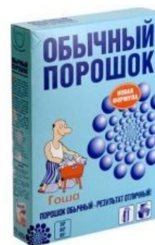
Обычный порошок гламурный