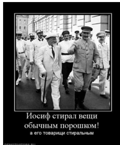
Сталин знает толк в сабже

Естественно, для того, чтобы рассчитывать на высокуюкупаемость товара, стоило придумать другие названия, но расчет тут как раз и был сделан на то, что никто их покупать не будет. Зато все мировые производители в своих рекламных роликах с экранов телевизоров говорили «одну футболку мы постираем обычным порошком, а другую...», «Обычная зубная паста не справляется с налетом...», «Вкус обычной жевательной резинки...» — другими словами занимались откровенной антирекламой. А это — повод для иска, иска на очень