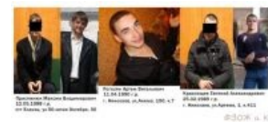
Другие герои статьи

В Николаеве трое отморозков заманили в квартиру 18-летнюю девушку, поочередно изнасиловали ее , а затем, чтобы скрыть следы преступления, придушили и попытались ее сжечь заживо на заброшенной стройке. В тяжелейшем состоянии пострадавшая 10 марта была доставлена в больницу. Образ маленького невинного ангелочка, святой мученицы, битой, но недобитой некими (о ужас!) друзьями-мажорами, детишками чиновников оказался очень годной иллюстрацией таких тем, как: « как страшно жить », « власти коррумпированы », « милиция нас не защищает ». Появились статьи в сотнях газет, теле- и радиоканалах и интернет-ресурсах, что впоследствии привлекло массу быдла, поцреотов и иных сочувствующих , оставивших более 9000 комментариев, а с ними и лулзов для ценителей жанра .