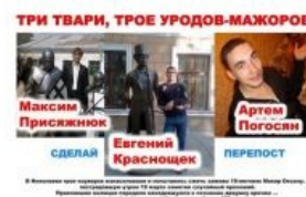
Негодующий постер. Madskillz , spam and butthurt

Между тем, по решению суда от 24 мая рассмотрение , назначенное на 12 июня 2012, должно было проходить в закрытом режиме с присутствием только участников процесса — это требование обвиняемых и их защиты.