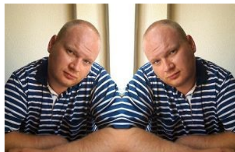
Он такая няшка

Завязалась дискуссия, в ходе которой ОП употребил словосочетание «сранный Турчак». Казалось бы — делов-то, мало ли кто что пишет в этих наших интернетах, однако спустя несколько часов в ЖЖ к Кашину явился губернатор Псковской области Андрей Анатольевич Турчак собственной персоной и потребовал сатисфакции :