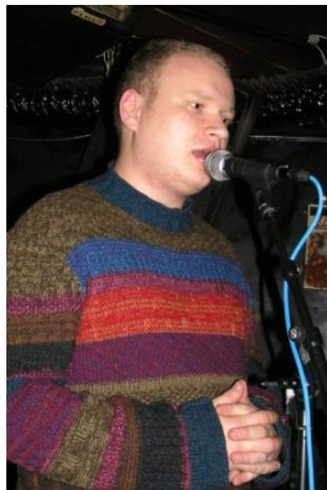
Кашин прозревает, даже когда поёт.