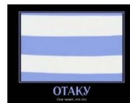
А это уже чуть-чуть посложнее