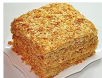
«Наполеон», взятый из палаты мер и весов Парижа. Бон аппети!