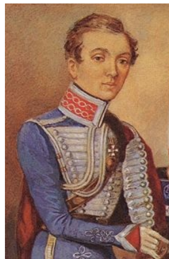
Кавалерист-девица. А ты бы вдул ?!