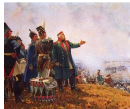
Пришёл Кутузов пиздить французов