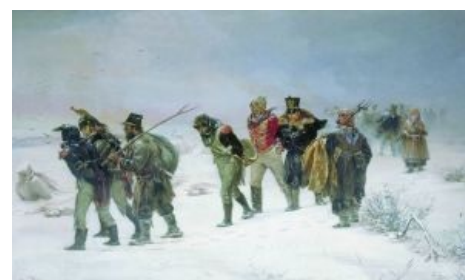
Полярный лис подкрался весьма заметно