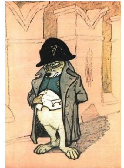
Наполеон-фурри внимательно читает этот раздел