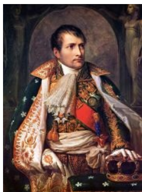
Наполеон. Nuff said

А началось всё с того, что русские уже были потрёпаны Наполеоном и, прикинув хуй к носу, решили таки не бодаться с французами, а договориться о взаимовыгодном сотрудничестве, которое он им сам же и предложил. Для коих целей на середине той самой реки был установлен плот с шатром дружбы и мира. Оба императора уединились в шатре с глазу на глаз, стараясь путём консенсуса извлечь свой профит. Получилось, мягко говоря, не очень. Всё подробно описано там , но если коротко — Наполеон Карлович становился анальным повелителем Европы с правом проводить гей-парады, Россиюшка молча глотает и прибегает на помощь по первому ишачьему зову (Лягушатия, в свою очередь, также обязывалась быть на подхвате), Пруссия же вообще оказалась в положении «раком». Повезло разве что пшкекам , да и то ненадолго. «Дела плохи», — подумали русские люди и затаились.