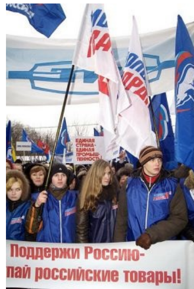
Митинг ЕдРа в поддержку провала