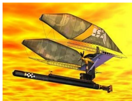
Боевая машина студии