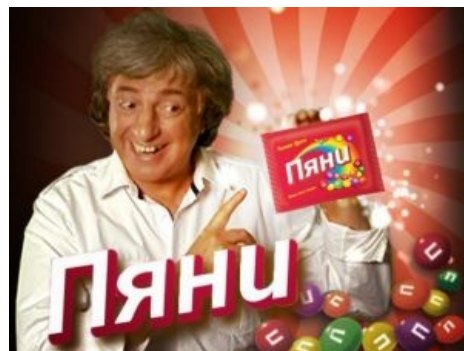
Постаревший Бонус ударился в коммерцию