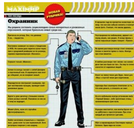
Эталон из палаты мер и весов

Не ЧОП, а подразделение Росгвардии (до 2016 — полиции ), занимается охраной разных объектов и личного имущества граждан. Кроме того, эти парни занимаются тем же, чем и обычные рядовые ППС-ники — периодически проверяют людей в розыске, пизнут нахуй никому не нужные рапорты , опиздюляют бомжей и т. п. Вооружены ПМами, иногда АКСами, одеты в бронежилеты. Иногда даже бывает, что в структуре этой охраны есть самый настоящий кинолог со своим питомцем . Кроме нарядов,