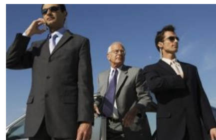
В своих фантазиях...