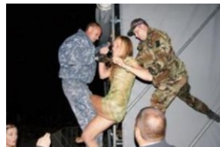
Они четко следуют принципу ББПЕ

https://www.youtube.com/watch?v=z8UM1TTVHss Рабочий день сабжа