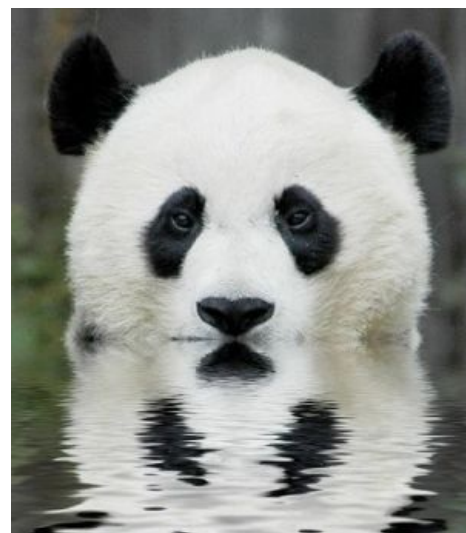
Погладь меня, сука!

Кстати, не всегда панда добра: известны случаи, когда панда ест, стреляет и уходит — об этом и в энциклопедиях написано: