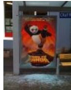
Haters gonna hate