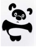
Это какая-то неправильная панда