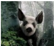
В/на Украине панды занесены в книгу о вкусной и здоровой пище