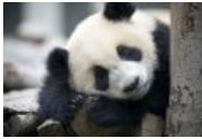
Ну разве можно ее не любить?