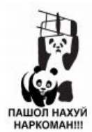
ПОШОЛ НАХУЙ НОРКОМАН!