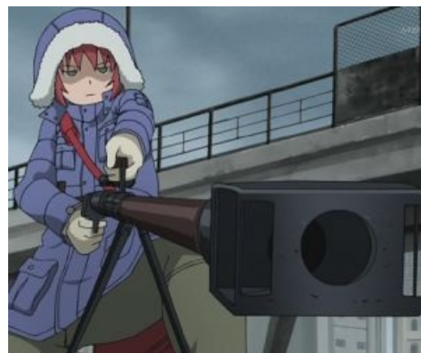
ПТРД и лоли созданы друг для друга

состоял в крайне низком ресурсе такого ствола (всего 500 выстрелов, тогда как у обычного нарезного — до 5000), а также в том, что сердечник снаряда изготавливался из totally дефицитного карбида вольфрама, что, впрочем, не помешало оружию использоваться всю войну и даже подбивать ИС-2 в