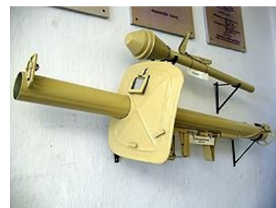
Шрек и фауст.

Смелая попытка арийцев сделать первый ПЗРК аж в 1945-м (!), стрелять предполагалось по медленно и низко летящим целям, но полнейший фейл заключался в том, что цели летать низко и медленно отказывались наотрез и упреждение выбрать в таких условиях просто не представлялось возможным, ни о