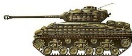
«Шерман» прикидывается кучей мешков с песком

Танкистам на заметку: если ваше быдлокомандование сэкономило на активной защите, то противоккумулятивные экраны нужно сделать самим из подручных материалов. Так, например, наши танкисты в Берлине наваривали на броню кровати с железной сеткой, ранее на которых пока ещё гордые арийцы перед отправкой на Восточный фронт стругали будущих мелких гансов. Впрочем, это лишь миф, ибо на самом деле на танки в Берлине подвешивали таки специально сконструированную сетку, да и та, как оказалось, против сабжа не помогала, ибо рвалась. Миф пошел из-за нескольких фотографий исов с этими экспериментальными сетками, массово такое не применялось, ибо результативность как от тюков и матрасов привязанных к броне .