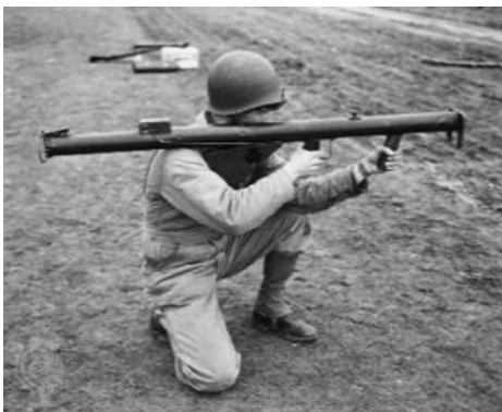
базука несет демократию

Американский расовый реактивный гранатомет. Впоследствии этим именем школата называла все калиберные реактивные гранатометы. Граната таки имеет реактивный двигатель, который разгоняет ее во время движения в трубе. Из трубы она вылетает и летит дальше уже по инерции, поэтому щитка и других защитных приспособлений не требует. Базука превосходила панцерфауст по дальности, уступала по бронепробиваемости. После войны пиндосами была запилена хтоническая «Супер Базука», пуляющая ракетами калибра 88 мм на расстояние до 450 метров.