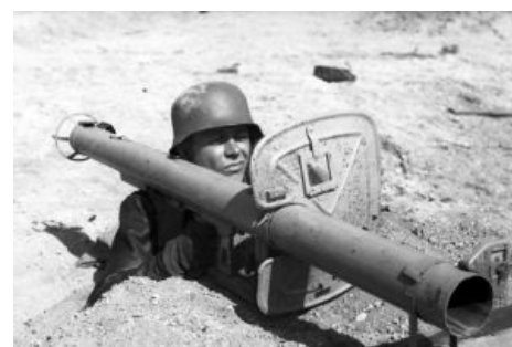
Танки грязи не боятся?