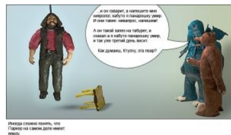
Всегда считал парня, что Паркер на самом деле имеет пещеру.

«Я всегда писал только то, во что верил. А уж как я научился продавать свою веру за приличные деньги - это, извините, моё ноу-хау.»