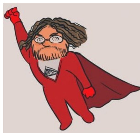
Captain ZOG to the rescue! (с)Заштопик

Блог Паркера был дважды выпилен из ЖЖ арбузой (в первый раз — за размещение плаката «Убей натовца», во второй — за призыв разбомбить Англию), после чего фигурант, поэкспериментировав с альтернативными аккаунтами ( maxim-kononenko , olia ) и top4top , перебрался сперва на тифаретник , а затем на уютный стэндалон, где ныне успешно совмещает разнообразные срачи с обличением политики компании СУП . Симулирует лютую, бешеную ненависть к Англии . Ныне ни в ЖЖ, ни на тифаретнике блог не ведет (хотя на каменты отвечает), транслирует туда идіють , в который пишет в таких неестественных количествах, что даже бывалые блоггеры фалломорфируют и делят сами себя на ноль. А однажды, после того, как Паркер, его жена и ребенок заболели еальмонеллёзом отравившись самодельной яичницей, сабж пожаловался об этом у себя в днявке , когда же его читатели пришли его пожалеть , Паркер демонстративно послал всех нахуй и продолжил писать в привычном режиме . Блоггер Паркер такой блоггер.