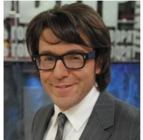
Главный тролль Первого. Был.

заставка программы УРГАНТ заставка программы УРГАНТ