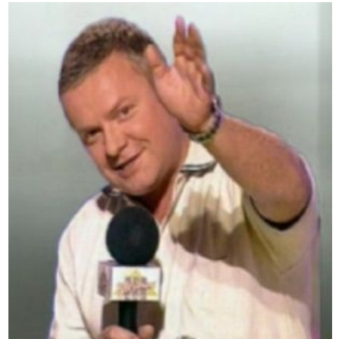
Давай, до свидания!

• Сергей Супонев. Человек, при упоминании имени которого большая часть анонимусов ностальгически вздохнёт и поблагодарит за счастливое детство. Появился на ЦТ в 1988 году, когда начал вести сюжеты в программе «Марафон-15» и «До 16-ти и старше». Позже, в 1993-м, сделал программу «Зов джунглей», на которой выросла вся нынешняя молодёжь. Программа отхватила «Тэфи-1999», Ёпрст это оценил, и с 1999-го Сергей, сплавив «Джунгли» в молодые руки, незамедлительно спустившие программу в УГ, стал редактором всех телеигр Первого Канала: «Царь Горы» и «Последний Герой» — его работа. Из-за того, что защищал покемонов от нападок журнализдов , уважаем покефагами. Но, к несчастью, Супоневу не хватало в жизни адреналина , и в итоге 8 декабря 2001 года он подавился мацой от сильного удара головой о пристань Волги ), где гонял на снегоходе. Good night, sweet prince.