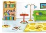
Вован на уютеньком