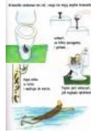
Путевка в жизнь