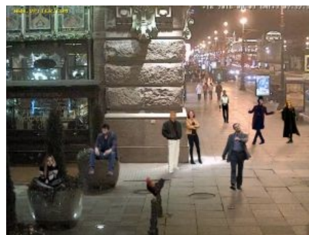
Невский проспект, например!

Это часть Невского практически не пострадала ни при Сталинских перестройках, несмотря на то, что все дома планировалось снести и построить новые в стиле Сталинского ампира, ни во время ВОВ . Другое дело Площадь Восстания, разделяющая проспект на две части, — из исторических построек сохранилось разве что вполне уёбищное здание Московского вокзала, идентичное по виду с Ленинградским в Москве, большинство же построек — ни в какие ворота не идущее совковое убожество, рядом с которым вышеупомянутый вокзал кажется шедевром архитектуры. Кроме того, уже современные градостроители построили стекляшку — торговый центр «Стокманн», ни разу не гармонирующий с окружающей застройкой. А вот ТЦ «Галерея» получился очень даже интересным зданием, с примечательным внешним видом , правда из-за неё убрали парковку, и теперь в радиусе 200 м от Московского хуй припаркуешься. (на самом деле под «Галереей» есть вполне себе годная двухэтажная подземная парковка на over 700 машиномест по цене 100 деревянных за 3 часа. Инфа 146%)