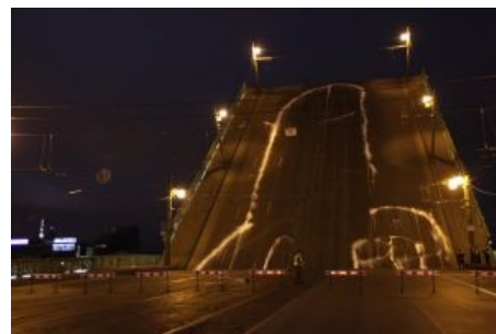
Тот самый эпичный рисунок

Аврора Крейсер — по одним данным, самая знаменитая еврейка Ленинграда, по другим — единственная девственница. Которая при уточнении оказывается кораблём Балтийского Флота, легендарным крейсером революции 1917 года. О том, как шестидюймовка авророва бабахнула по Зимнему дворцу, известно даже большинству нынешних школьников. Историки, правда, спорят, — шмаляла ли красавица «Аврора» холостыми, лишь давая сигнал к штурму и доводя на психику окопавшихся в Зимнем министров-капиталистов и юнкеров с бабьим батальоном. Или это был всё-таки реальный обстрел. Следует сказать, что упомянутый выстрел был уникален: все знают, что выстрел был один, но одновременно все знают про залп «Авроры». Между тем залп — внезапно по определению несколько одновременных выстрелов.