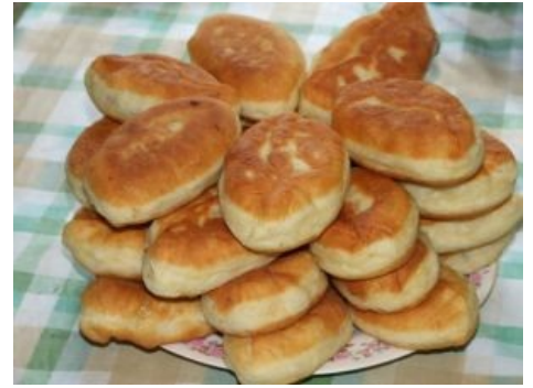
Пирожки как они есть

я булочку с повидлом ел с тех самых пор при виде трупа рот наполняется слюной