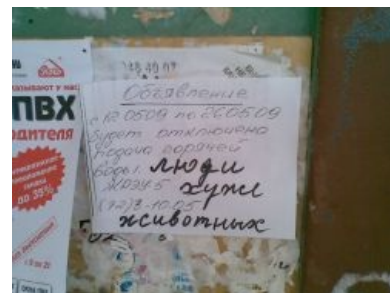
Вот так вот

Если вкратце, каждое лето или в конце весны, в точно установленный день (но каждый год — разный ) отключают горячую воду, совсем. За пределами дефолтных городов отключение затягивается на два-три месяца (а то и на всё лето), в зависимости от местности и охуевания коммунальных служб. Правда, бывают и исключения, когда жильцы скидываются на свою собственную котельную, с котлами и кочегарами , и имеют отопление вовремя и отключение горячей воды всего на две-четыре недели. Также возникает новая тенденция: многие города обрели силу (борьба за деньги) и волю (борьба за избирателя) напрячь энергетиков, и заставить последних ремонтировать свои установки и сети дней за семь, при этом сами городские коммунальщики сильно не спешат.