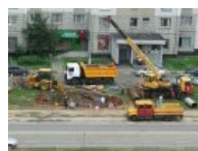
Работники лопаты и Автономность автогена