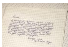
Прощальная записка одной тян