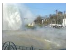
Разлилась широко горячая вода