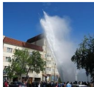
Это не гейзер, как вы могли подумать, а феерический прорыв теплотрассы

При более глубоком рассмотрении проблемы выясняется, что подобные системы центрального отопления — это большая редкость в мире. В этих ваших развитых странах в краны квартир подаётся только холодная вода. Нагрев воды осуществляется локальным электронагревателем, а отопление — общим котлом в подвале. Таким образом, отсутствуют потери тепла (а значит, экономятся энергоносители) при транспортировке воды по трубам. Дабы не нарушать баланс общего количества идиотизма в природе, в «развитых странах» горячая вода, полученная в процессе преобразования тепла в электричество, не используется, а медленно и печально остужается на месте. Впрочем, там это дело компенсируют как могут — и турбины-то у них оборотистее, и котлы котлистее, и в результате в этих ваших Европах электрический КПД ТЭС 50-60%, а в этой стране