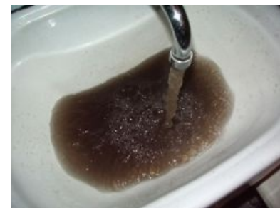
Только в СНГ из крана по утрам течёт горячий кофе

пропадает. Или не внезапно. Скажем, отключение обещают в понедельник утром, но уже днем в воскресенье вода становится чуть теплой, а потом и вовсе остывает. Население, не имеющее водонагревателей , впадает в уныние.