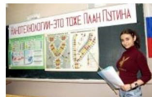
Уроки путинизма в средней школе

небезызвестные «Рухнома» и «Семь принципов Ислама Каримова» ныне уже почивших Отца всех туркмен и Отамиза соответственно, или же стремящихся таковыми стать (пример — Программа КПРФ, которую Зюганов архинастойчиво и безуспешно пытается всем всучить).