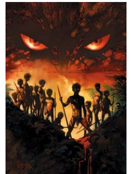
Главное — не смотреть в глаза

Спасение в лице взрослых прибывает как раз в тот момент, когда остров уже почти сгорел, а Ральфа собираются убить и насадить его голову на палку.