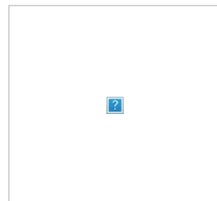
Поручик Ржевский в фильме Рязанова (справа)