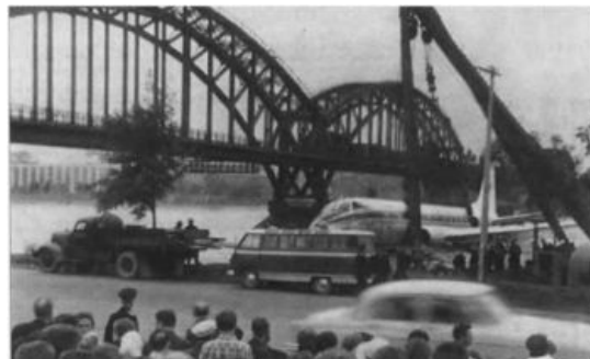
Запаркован у перрона