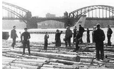
А с платформы говорят: «Это город Ленинград!»

Инцидент почти повторился на нашей памяти, когда в 2009 году американский A320, взлетающий из ЛаГардиа (LGA), получил над Манхэттенем по несколько птичек в каждый мотор на малой высоте. Капитан Салленбергер тогда тоже посадил машину в речку Гудзон между двумя мостами и стал национальным американским героем типа Гагарина . Кстати, доставил телезрителям, когда на вопрос телеведущей «Молились ли Вы, приводняя самолёт?» ответил: «Я сажал самолёт, а не думал. Полагаю, что о молитвах обильно позаботились пассажиры».