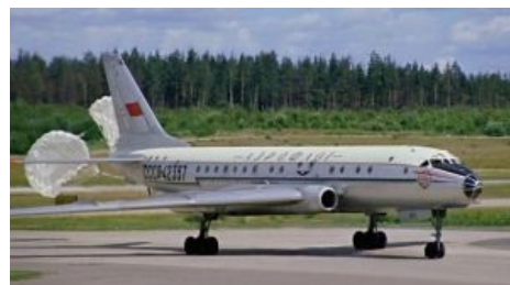
Папа Ту-104 удачно приземляется с парашютом после планового отказа двигателей