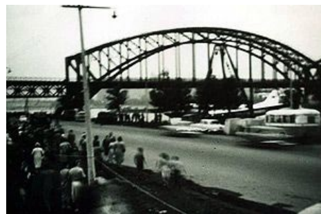
На фоне моста, до которого не доплыл