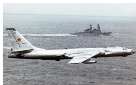
А это его дедушка Ту-16 на фоне коварных пиндосов (кстати, НАТО зовёт его Badger )