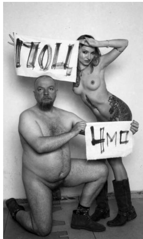
Пахом в курсе