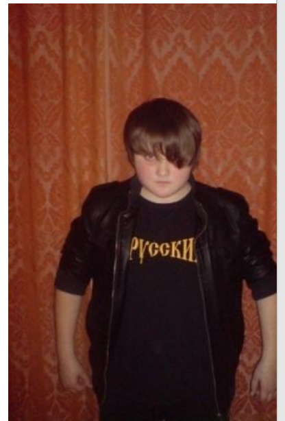
Встречаются экземпляры с внешностью Джастина