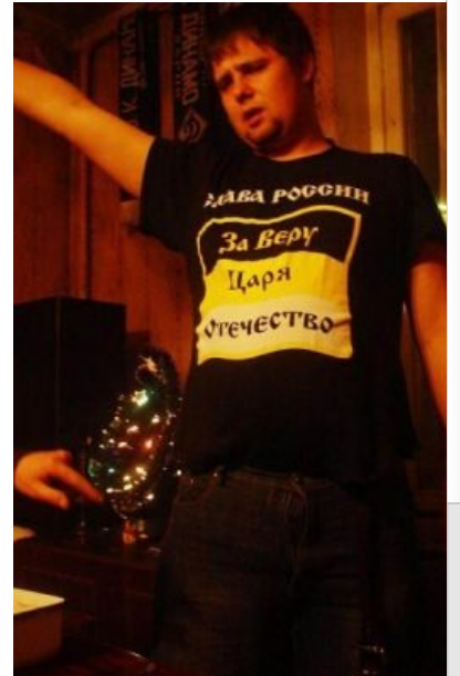
Типичный представитель вида