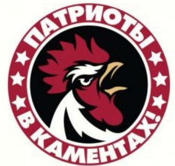
Когда вата атакует стену

Кроме того, замечено возбуждение головокостной активности поцреотов при цитировании небезызвестного « Словаря Сатаны » Амброза Бирса