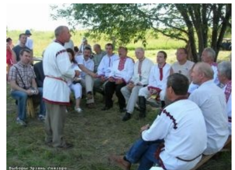
эрзянские поцреоты detected

Самое же главное — каждый год, начиная с 1999 года, общепризнанные эрзянские поцреоты в третьей стадии так отрывают жопу от стула (что само по себе примечательно) и собираются у черта на куличках — на «народное моление» (по-эрзянски — Раськень Озкс), где ни много ни мало выбирают себе ежегодного «великого царя эрзянской земли». Думается, таким эпическим троллингом официальной власти ныне не может похвастаться ни одна другая республика России. Алсо, эрзянские поцреоты примечательны тем, что у них виноваты во всем не жиды, ZOG и Америка (что характерно для русских поцреотов) и даже не только русские (что типично для большинства местечковых национал-поцреотов), но и подлые мокшанские чиновники, забравшие всю власть и истребляющие эрзянский народ. Уровень пафоса при этом весьма и весьма достойный, таки да.