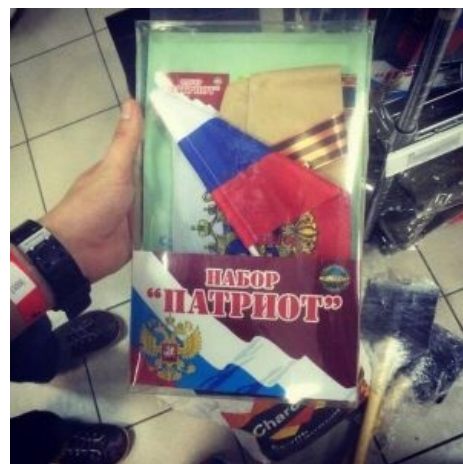
Набор для начинающих.