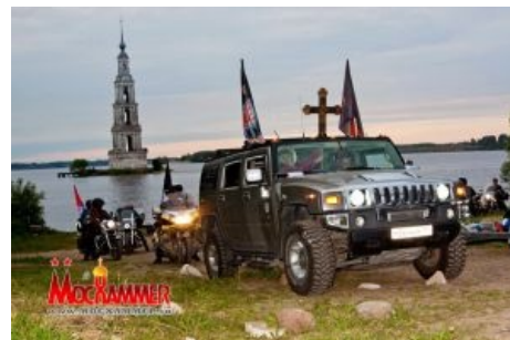
Истинные православные поцреоты на Хаммерах