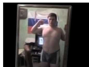
Унылое поцреотическое говно