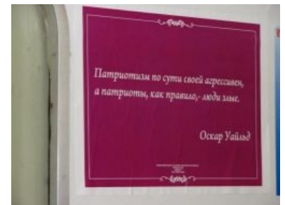
Годный троллинг поцреотов в новосибирском метро