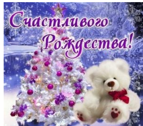
Пример блевотной открытки.