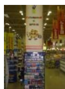
Специальное предложение для школьников.