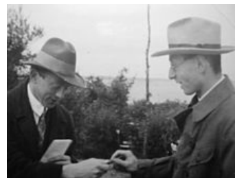
Гейзенберг и Вигнер явно замыслили новый принцип

На самом деле, всяких принципов, помимо принципа Арнольда, тысячи, и он придумал даже не первый. Попадаются и весьма меметичные. Например есть исторически первый принцип Юджина Вигнера «О непостижимой эффективности математики в естественных науках» (учи матан, сука!). Есть к нему ещё и антипринцип Гельфанда «непостижимая неэффективность математики в биологии» (всё равно учи!). Хорошо известен среди технофашистов принцип Вайнберга о «непостижимой неэффективности философии».