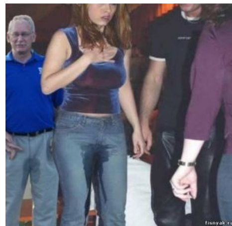
Небольшое лирическое отступление