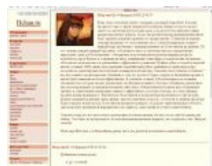
Объявление о продаже