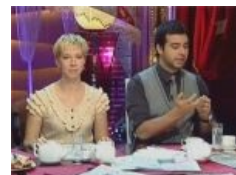
Лазарева смотрит не на вас, а на говно

Иван Ургант (в определенных кругах также известен как Кочанотереблящий , что кое на что намекает!!!) — эстонский ЕРЖ , питерская интеллигенция, позиционирующая себя как небыдло , с голосом батареи в начале отопительного сезона. Обладает умением шутить с минимальным, по российским меркам, удельным весом петросянства и откровенных фэйлов. Знает, что зрителю необходимо потешить ЧСВ , поэтому всегда оставляет место для элементарного умозаключения, которое необходимо сделать, дабы уловить соль шутки. Шутит, не касаясь излюбленных другими юмористами вечных ТЕМ . Однако потребность в постоянном хохоте окружающих обезьянок постепенно приобрела форму патологии, и Ваня неудержимо скатывается. Любимый стиль — толсто намекнуть своим соведущим на ничтожность оных и их изъяны. Является ведущей фигурой посиделок, связующим звеном между толстым и иногда абсурдным (еще со времен «Уральских пельменей») юмором Светлакова и штампованными шутками от Мартиросяна.