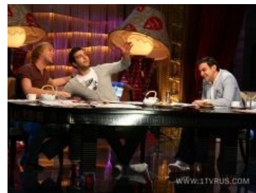
Прожекторперисхилтон, прожекторперисхилтон everywhere!

Суть такова: за одним столом, обложившись газетными вырезками, сидят два еврея, армянин и, для разнообразия, — русский, но не с целью оповещения населения, а юмора для. Затем в студии появляется гость/гости, которых невозбранно пеарят вышеуказанные петросяны, рукоположённые Эрнстом в спасители отечественного йюмора. Выбор тем рандомен, но злободневность присутствует — иногда шутили даже про Путиномедведева , но очень осторожно, справедливо опасаясь анальных кар. Раньше в конце исполняли что-нибудь под собственный аккомпанемент. Основная цель — смешать конкурентов с помётом и собрать побольше людей у зомбоящика на своей частоте.