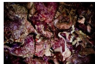
Вот так-то, амиго!

К счастью, прилавки с алкогольными напитками (единственным, за чем сюда может прийти человек, не относящийся к постоянному контингенту «Просрочки») расположены поблизости от входа. Штат работников магазина чуть более, чем полностью состоит из хачей, что как бы намекает нам — травят русский народ. Но существует и вероятность, что хачи эти — всего лишь нанятые за гроши гастарбайтеры, а хозяин — русский, либо же ЕРЖ.