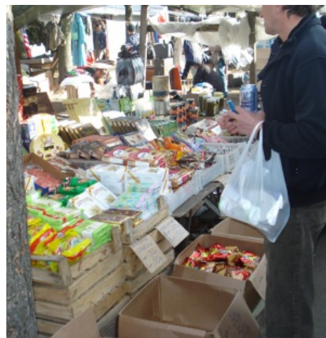
Шармэль! Просрочка на Уделке.