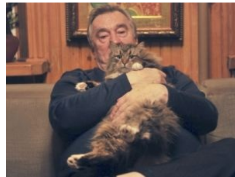
Проханов и его кот

«ГУЛаг — это проявление Божественного света »