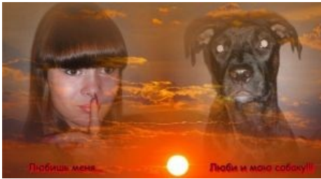
ТП и её сраный madskillz

Зооматери — то, во что рано или поздно превращаются зооземо. Самоназвание — «опекуны бездомных животных», этот термин юридически закреплён в законодательстве некоторых городов Украины и России (например, в Перми и Киеве). Пытались его ввести в Москве в 1990-е, но безуспешно.