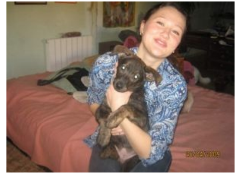
ТП и её сраный пёсик

Зооматери — опекуны, собираются компашкой из себе подобных и отправляются в городской парк, чтобы на детской площадке разбросать мешок с пищевыми отходами для стаи псин или похожих на них существ. Там же строят им же будки из коробок и фанеры.